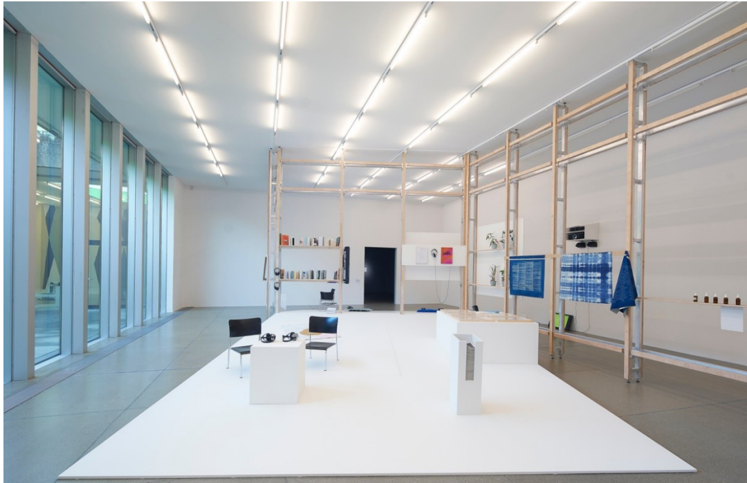
Romy Nina Rügger (Pressebild Nr. 2)

Bitte verwenden Sie jeweils die Urhebernachweise der Pressebilder (siehe letzte Seite). Weitere Bilder und Download-Ordner stellen wir Ihnen auf Anfrage gerne zur Verfügung.