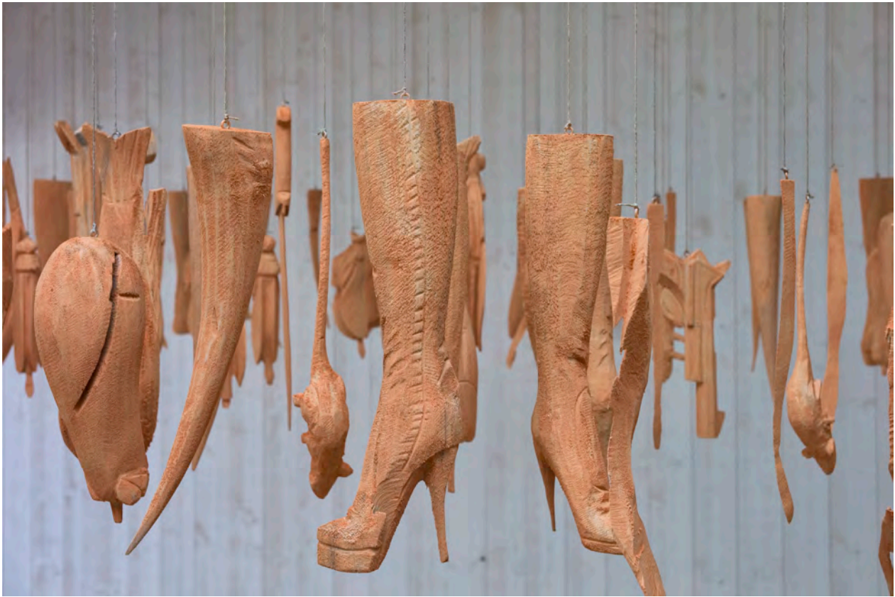
Rochus Lussi (Presse Bild Nr. 9)