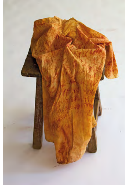
Nesa Gschwend (Presse Bild Nr.2)