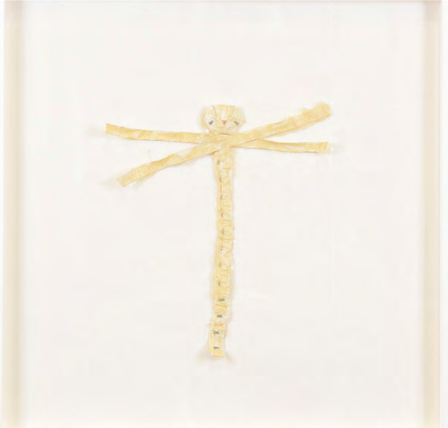
Heidi Bucher (Presse Bild Nr.0)

Bitte jeweils Fotocredits der Pressebilder (siehe Anhang) verwenden. Weitere Bilder und Download-Ordner auf Anfrage anliker@akku-emmen.ch oder info@claudiawaldner.com