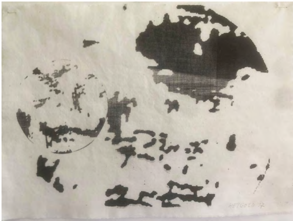
Otto Heigold, Mikro- und Makrokosmos/ Angaben zu Proportionen fehlen. So wird, je nach Sichtweise, der Mikrokosmos zum Makrokosmos und umgekehrt. © Otto Heigold (Presse Bild Nr. 15)

Eröffnet wird am 13. Januar nicht nur die Ausstellung Haut, sondern auch der Raum: Otto Heigold. Zum 80. Geburtstag des Künstlers Otto Heigold bespielen wir das ganze Jahr einen RAUM mit wechselnden Werken des Jubilars. Je Ausstellung wird eine kuratorische Auswahl an Zeichnungen und Werken zu sehen sein. Durch die Wandlung der Ausstellungssituation entsteht eine Zeitreise. In Bezug auf Haut (das Handwerk), sowie dem Haus (vom Atelier bis zum weiten Gedankenkosmos als Kunstraum) erhalten wir jeweils einen anderen Blick auf das vielfältige künstlerische Schaffen von Otto Heigold.