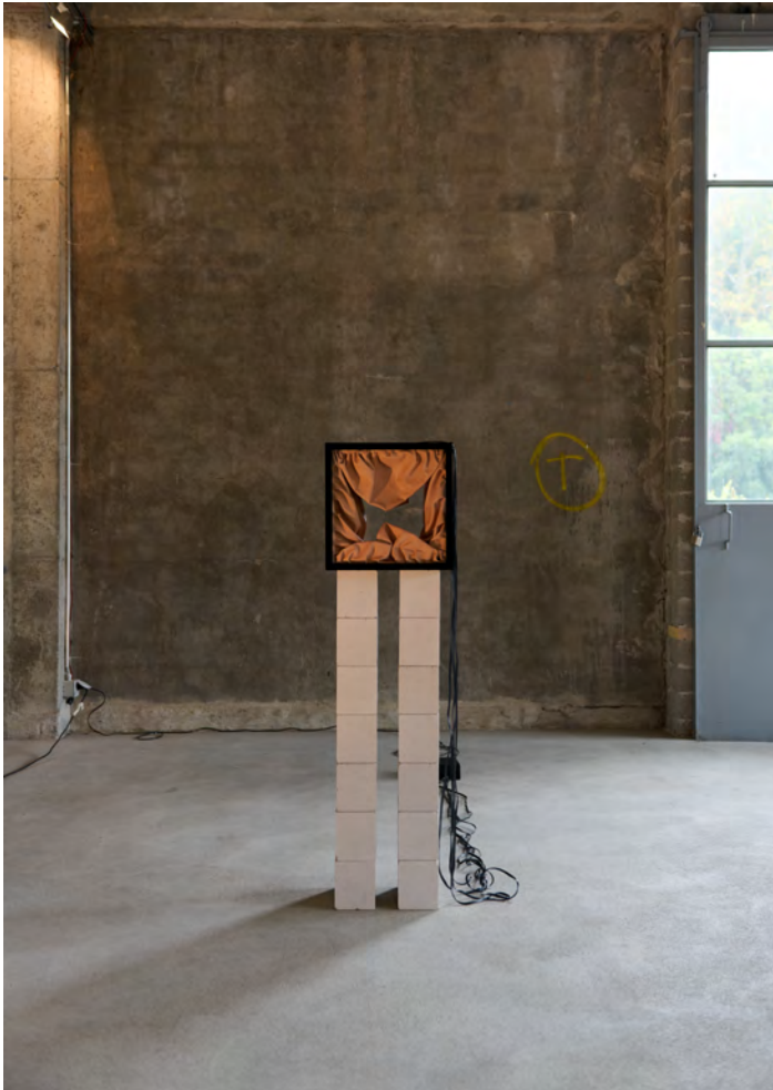
Ronja Römmelt (Presse Bild Nr. 14)