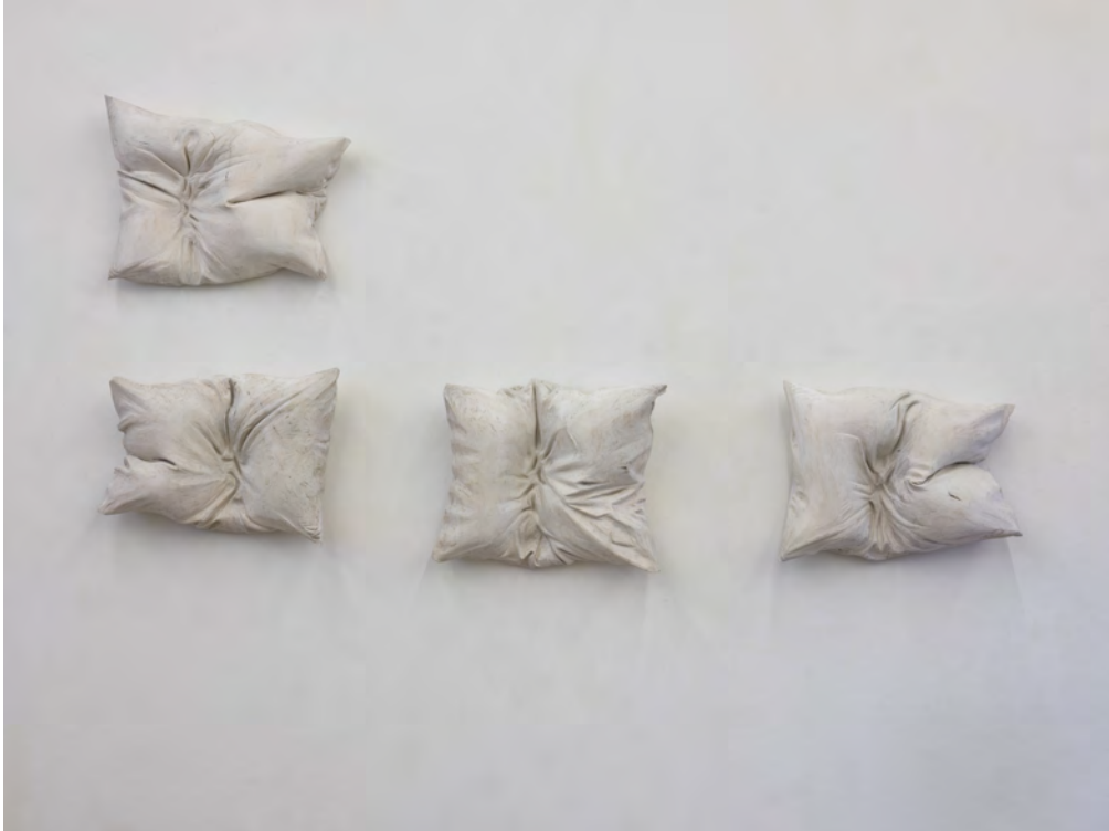
Rochus Lussi (Presse Bild Nr. 8)