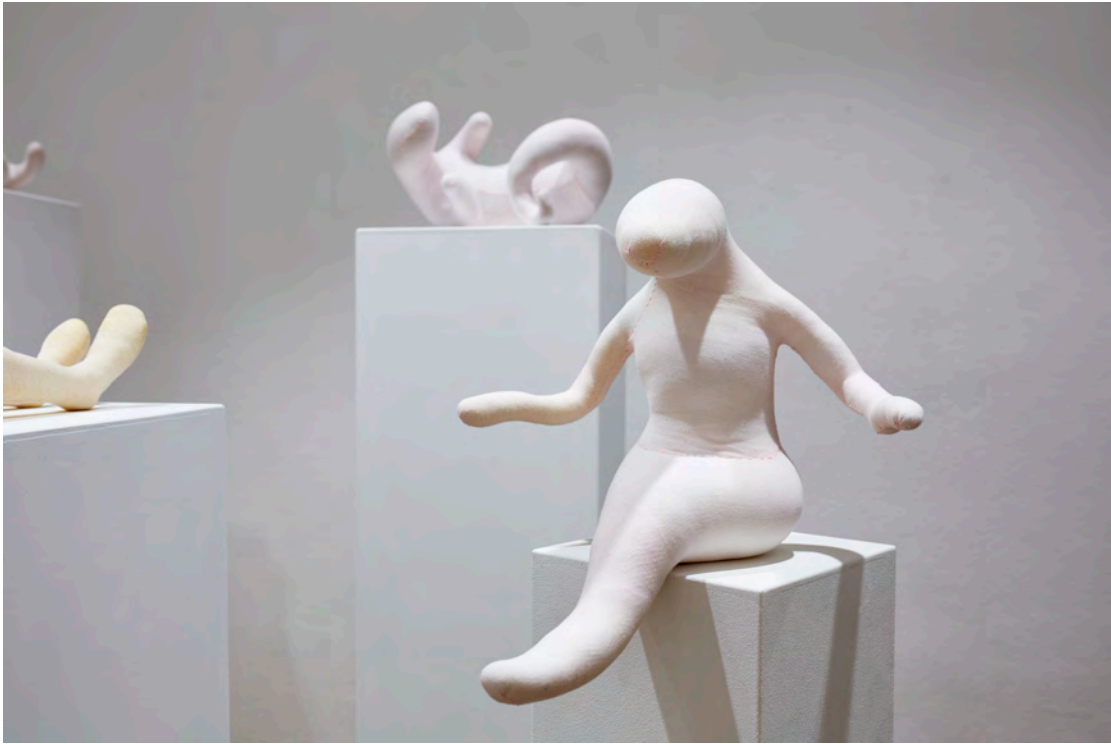
Victorine Müller (Presse Bild Nr.3)