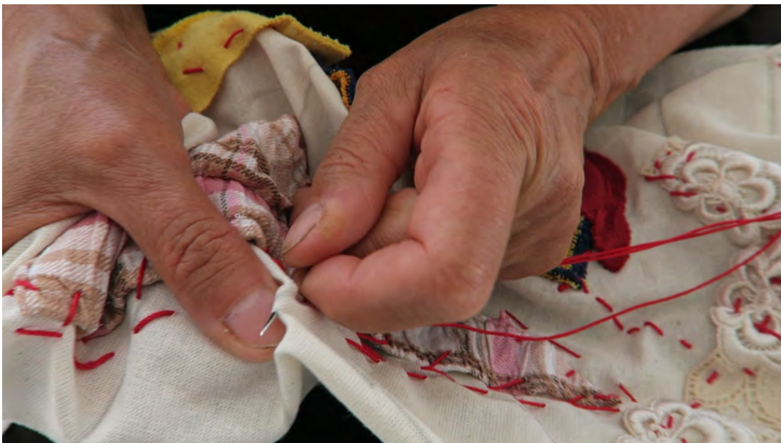
Nesa Gschwend (Presse Bild Nr.1)