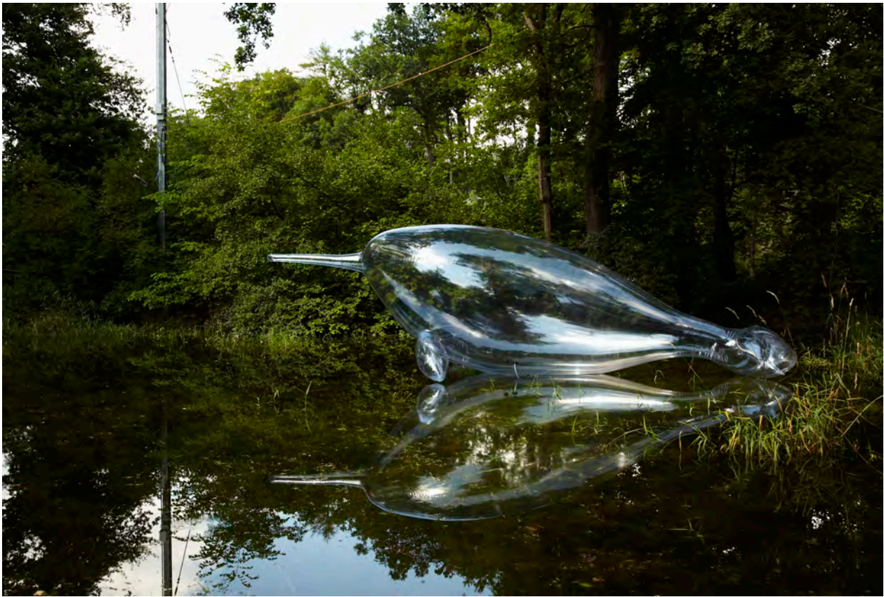
Victorine Müller (Presse Bild Nr. 4)