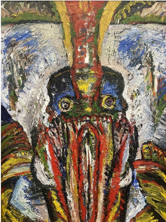
Bruno Murer (Pressebild Nr. 5)