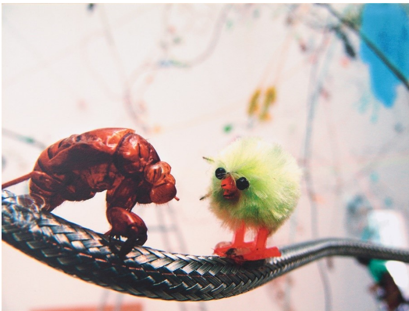
Steiner / Lenzlinger (Pressebild Nr. 6)