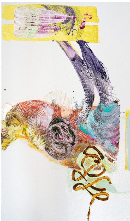
Pia Fries (Pressebild Nr. 3)

Bitte jeweils Fotocredits der Pressebilder (siehe Anhang) verwenden. Weitere Bilder und Download-Ordner auf Anfrage anliker@akku-emmen.ch oder karl_buehlmann@bluewin.ch