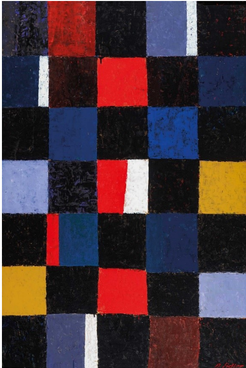
Alfred Sidler (Pressebild Nr. 1)